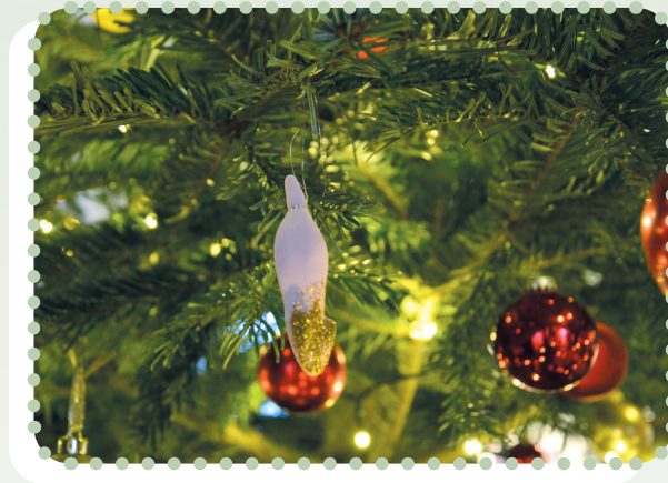
Habt ihr schon Theophils besonderen Weihnachtsbaumschmuck entdeckt?

Mit seinem großen Abteikaterweihnachtswissen fordert Theophil zum Rätseln, Schätzen und Ausprobieren, aber auch zum Hinterfragen und Schmunzeln auf. Eine Gabe vom Nikolaus lässt sich ebenso finden wie Mitnahme-Bastelvorschläge für zu Hause. Theophils Glitzerpfoten-Weihnachtsausstellung bietet die Gelegenheit, mit allen Sinnen in die besondere Atmosphäre der Abtei-Weihnachtswelt einzutauchen.